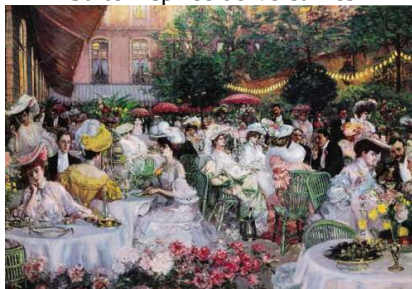
Inauguration du Ritz Paris

On this day, all the high society of Europe and America gathered to inaugurate the Hotel Ritz . It is located on place Vendôme in the 1st district of Paris. It has been created by the Swiss Cesar Ritz.