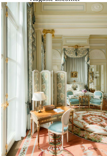
Suite inspirée de Versailles