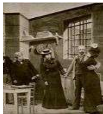
Entrevue de Dreyfus et de son épouse

But, suddenly, around 1928, journalists rediscovered him, crowning him a precursor and a poet. A gala was organized for the ancestor, he was decorated and placed in a retirement home, he and his family, the “Château d’Orly”, where they lived in peace, being the only residents, until 1938, year of his death.