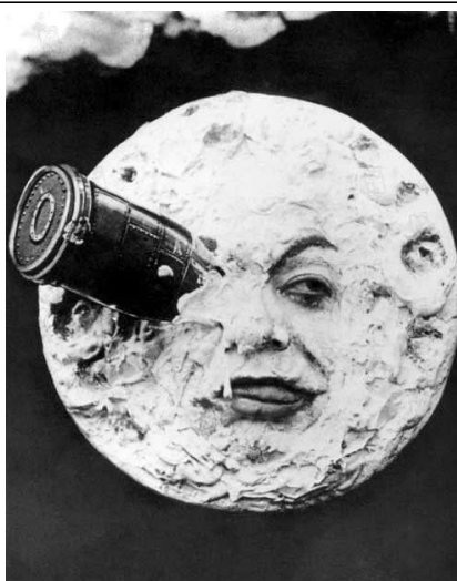
“Le voyage de la Terre à la Lune”