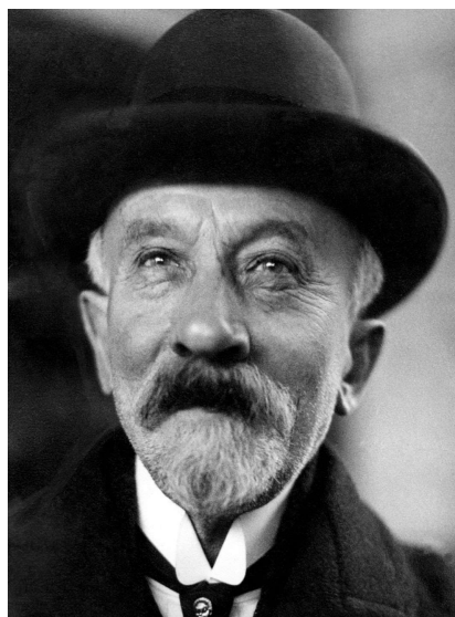
l’artiste consacré et couronné

“The Trip to the Moon” was inspired by the novels of Jules Verne: “From the Earth to the Moon”, and that of H.G.Wells: “The First Men in the Moon”. A congress of six astronomers gather on the moon with the help of a rocket-shell. There, many adventures happen to them.