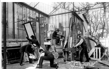
Atelier Méliès à Montreuil-sous-Bois

Mais, brusquement, vers 1928, des journalistes le redécouvrent, le saccrnt précurseur et poète. On organise un gala pour l’ancêtre, on le décore et on le place dans une maison de retraite, lui et sa famille, le “Château d’Orly” où ils vivront tranquilles, étant les seuls résidents, jusqu’en 1938, année de sa mort.